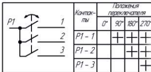
Рис.3 Схема электрическая для PROF-05220