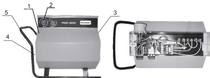
Рис. 1 тепловая пушка

5.1 Схема тепловой пушки представлена на рис. 1.